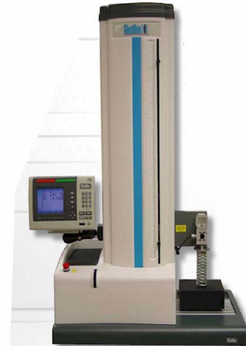
TCD1100 System shown testing an automotive spring.

La nueva plataforma de pruebas ha sido perfeccionada para el medio ambiente de producción. Se caracteriza por un sofisticado programa interno que le permite hacer casi cualquier tipo de prueba SIN una computadora personal o programa externo.